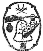
MTRA. THANIA EDITH MORALES RODRÍGUEZ. SÍNDICA MUNICIPAL DE TLAJOMULCO DE ZÚÑIGA, JALISCO.

Municipio de Tlajomulco de Zúñiga, Jalisco SINDICATURA MUNICIPAL