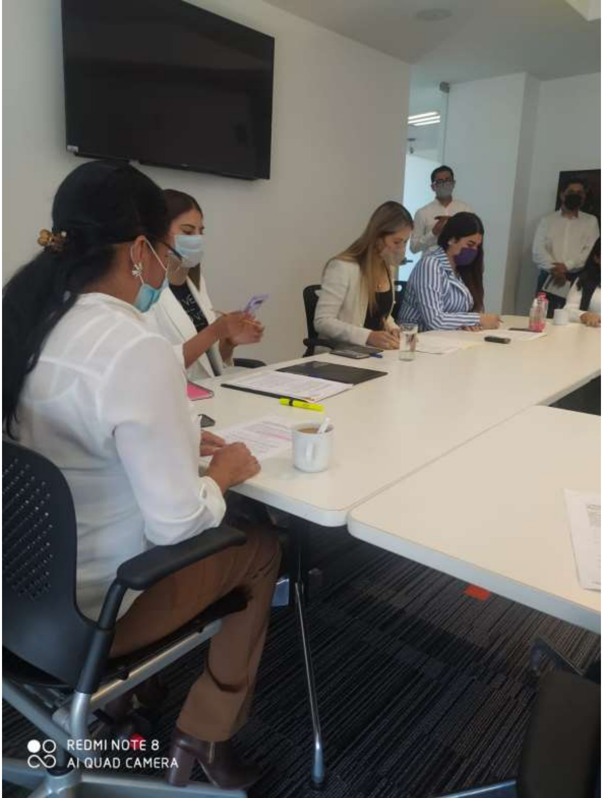
Instalaciones de las comisiones edilicias mes de octubre