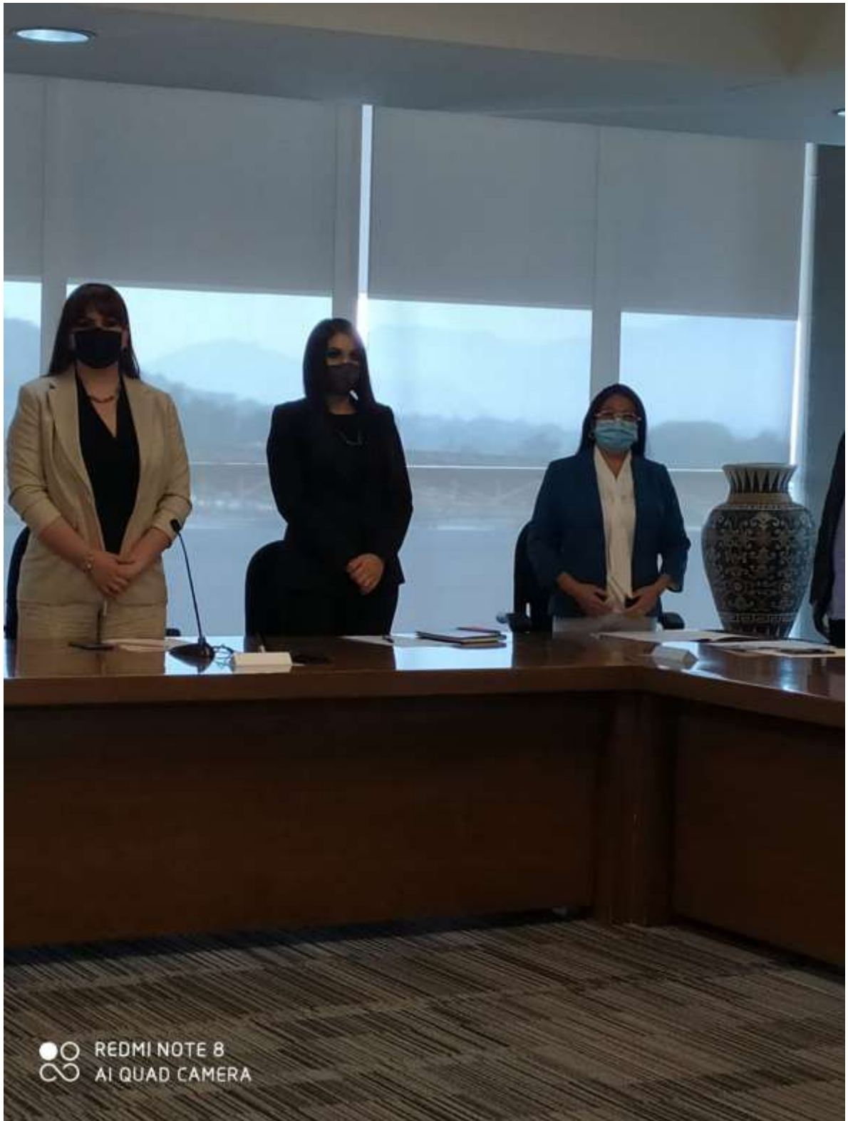
Instalaciones de las comisiones edilicias mes de octubre