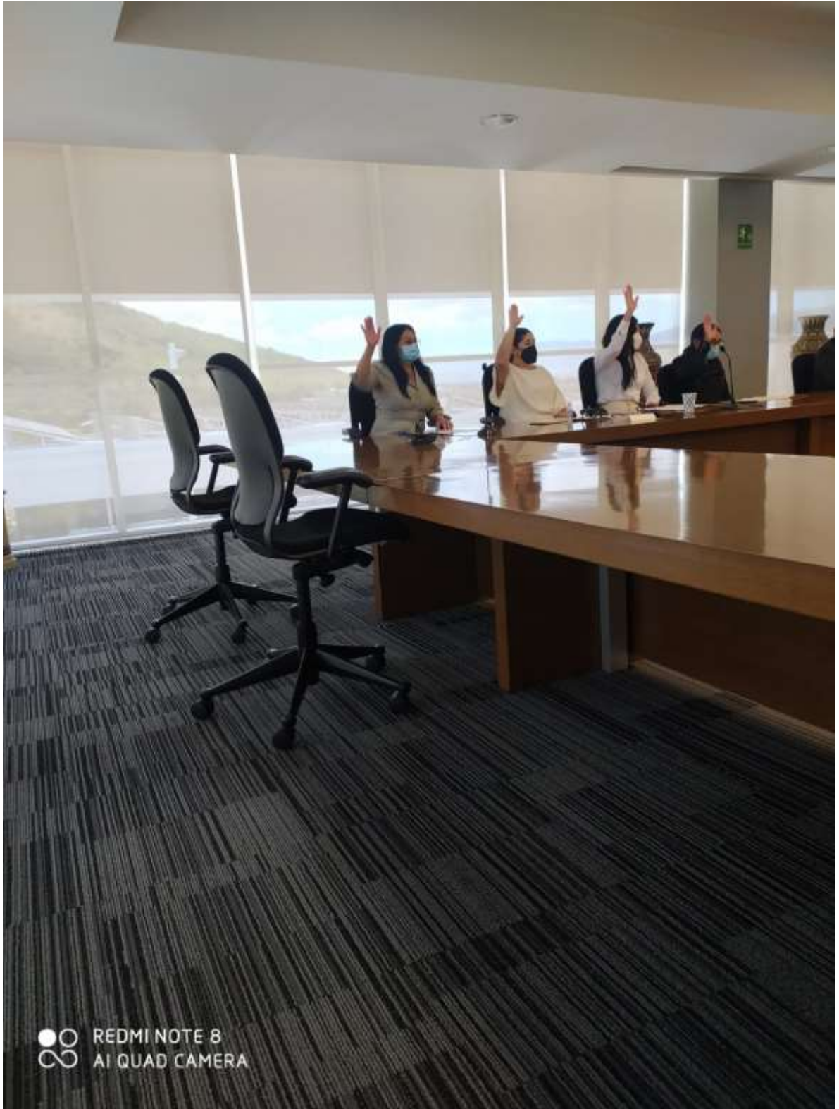
Instalaciones de las comisiones edilicias mes de octubre