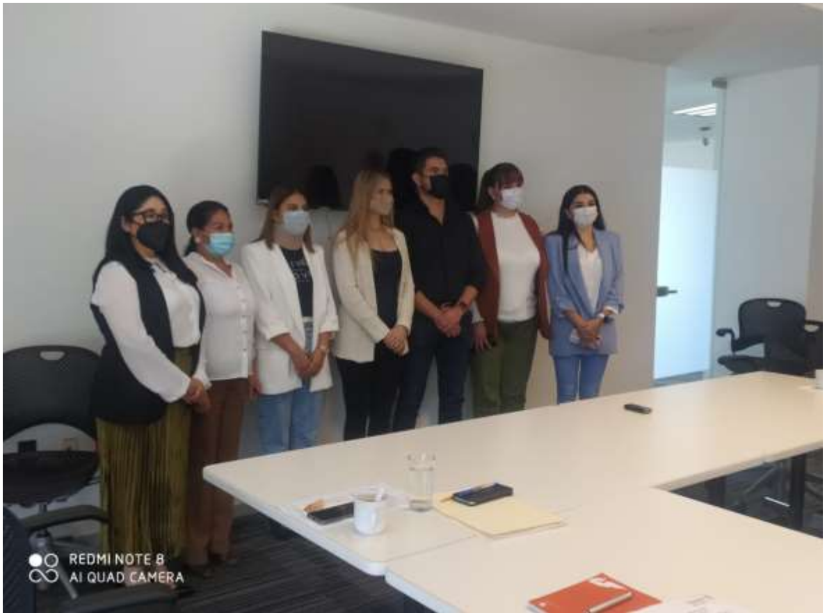
Instalaciones de las comisiones edilicias mes de octubre