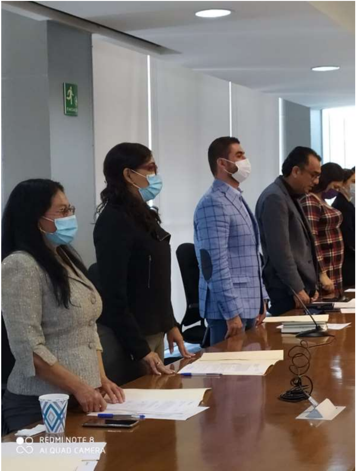
Instalaciones de las comisiones edilicias mes de octubre