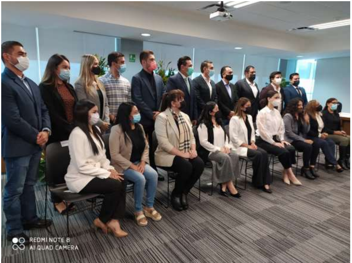
Primera sesión del pleno