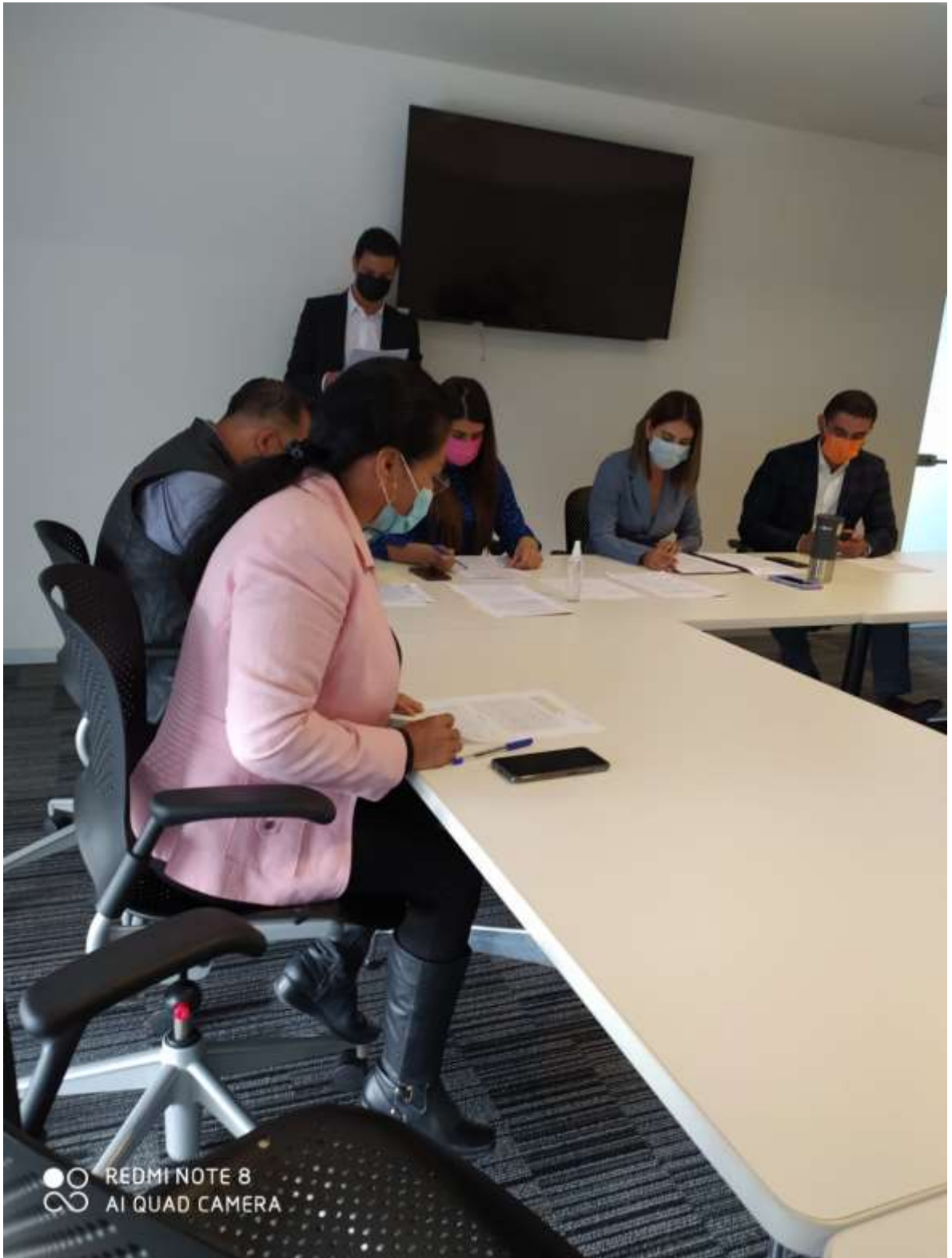
Instalaciones de las comisiones edilicias mes de octubre