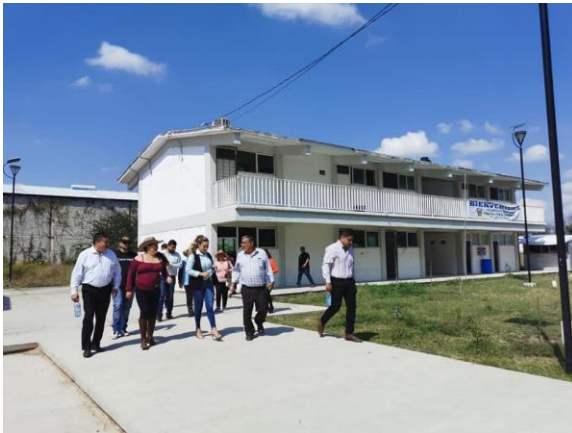
El Zapote del Valle