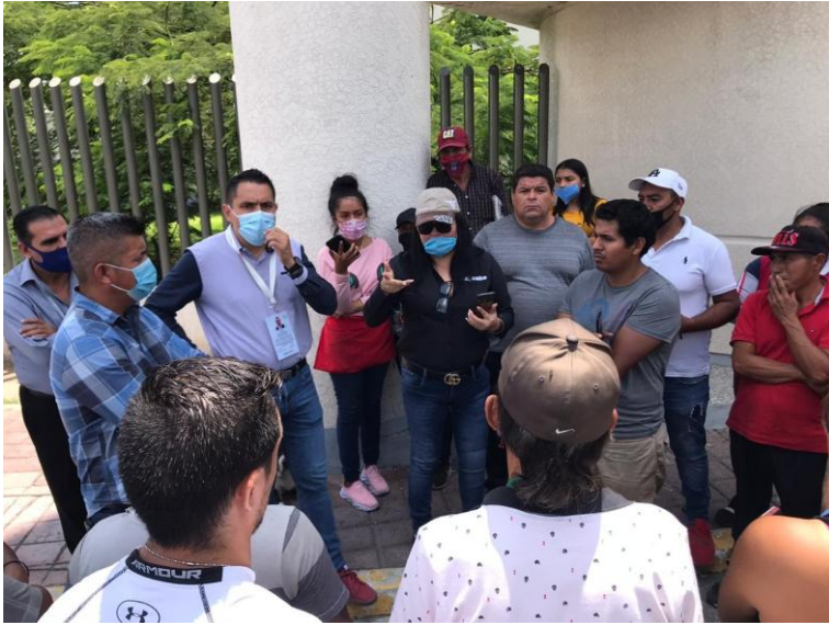
En apoyo a los comerciantes de la Clínica 180 del IMSS