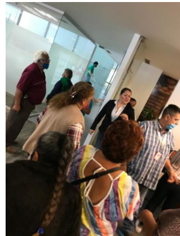
Atendiendo a los Ciudadanos desde la Oficina.